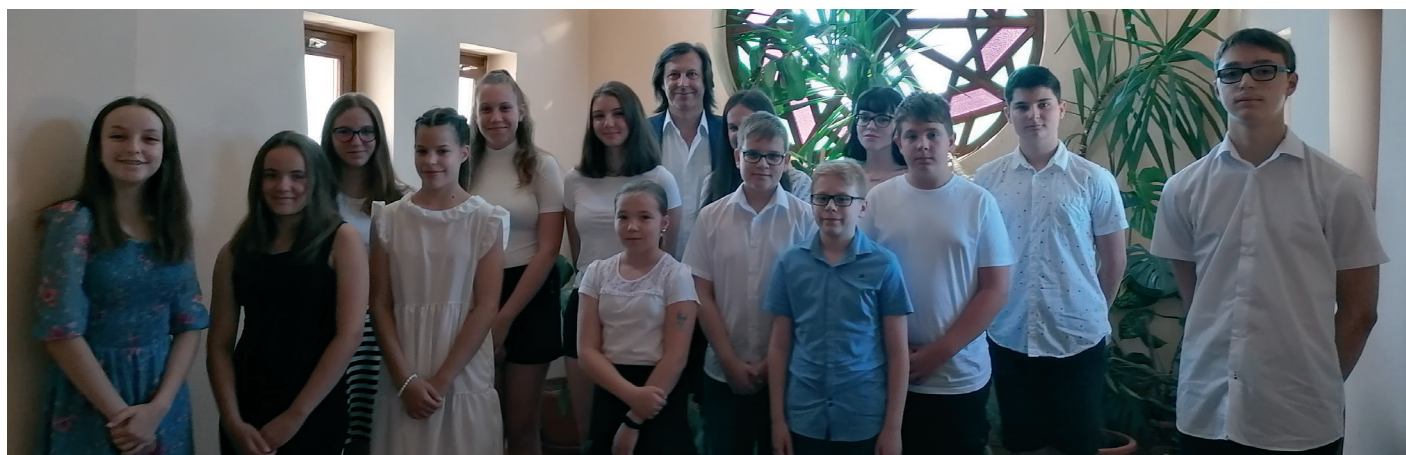
Kitűnő tanulók 2020-2021